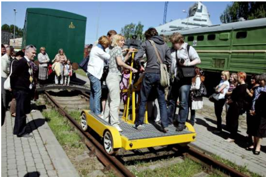
Noslēgumā viesi izmantoja izdevību, lai pavizinātos ar drezīnu. Visi pasākuma foto aģentūra F64.

Dzelzceļa muzejam šī bija lieliska iespēja saviem kolēģiem gan parādīt sasniegto, gan dzirdēt profesionāļu viedokli un atsauksmes. Pasākumu, ar uzstāšanos kuplināja deju kolektīvs „Bānītis”.