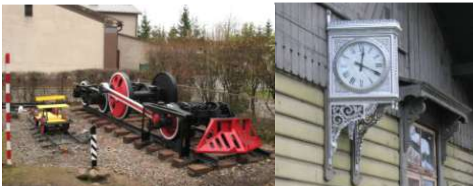
Āra ekspozīcijas fragments. Atjaunotais pulkstenis.

2012.gadā. liels darbs tika ieguldīts Jelgavas ekspozīcijas pagalma sakārtošanā un tur atrodošos priekšmetu restaurācijā. Kopumā tika restaurēti četrdesmit krājuma priekšmeti un piecpadsmit priekšmeti, kas nav iekļauti muzeja krājumā, bet papildina muzeja ekspozīciju. Jelgavas ekspozīcijā tika restaurēts arī perona apgaismes lukturis un divpusējais stacijas pulkstenis, kas izvietots uz ēkas fasādes.