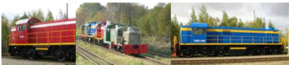
Atjaunotās manevru lokomotīves.

Pārskata gadā tika atjaunots krāsojums trijām manevru lokomotīvēm. Darbus veica Rīgā muzeja teritorijā, tā ikviens apmeklētājs varēja sekot līdz darba gaitai. Lokomotīvēm pilnībā tika attīrta vecā krāsa tās gruntēja un krāsoja atbilstoši to rūpnīcas krāsojuma standartiem.