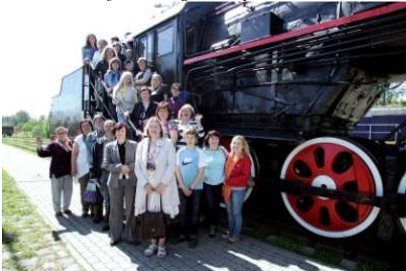
Grupas foto pie L sērijas lokomotīves tipiskā padomju stilā;