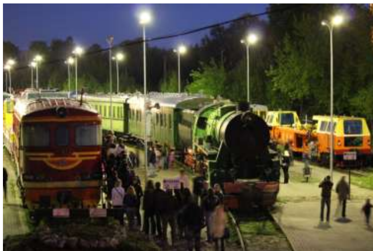
Ritekļu brīvdabas ekspozīcija Muzeju naktī.