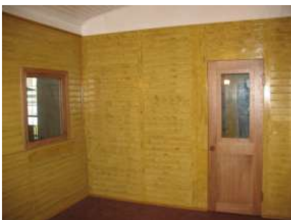
Foto: Pirmais Latvijas valsts dzelzceļu III klases pasažieru vagoni, 1925. gada modelis. Izgatavots a/s „Fenikss” Rīgā.

Atjaunots vagona dēļu apšuvums un veikta sienu krāsošana. Oktobrī tika uzsākta vagona interjera iekārtošana. Līdz gada beigām darbnīcās izgatavoti soli un to metāla konstrukcijas, lākteņi, lampas, žalūzijas u.c. elementi. Sākās arī darbs pie virsbūves apšuvuma un jumta metāla daļu renovācijas. Darbu noslēgums paredzēts 2012. gada martā.