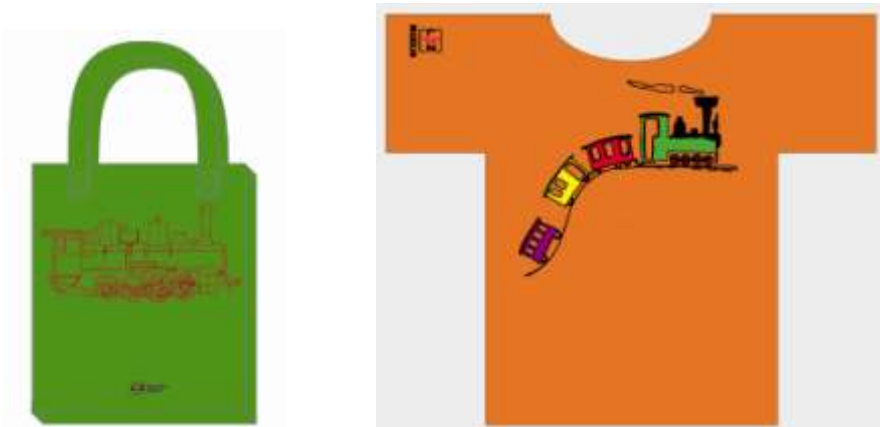
Att. Jaunākie suvenīri.