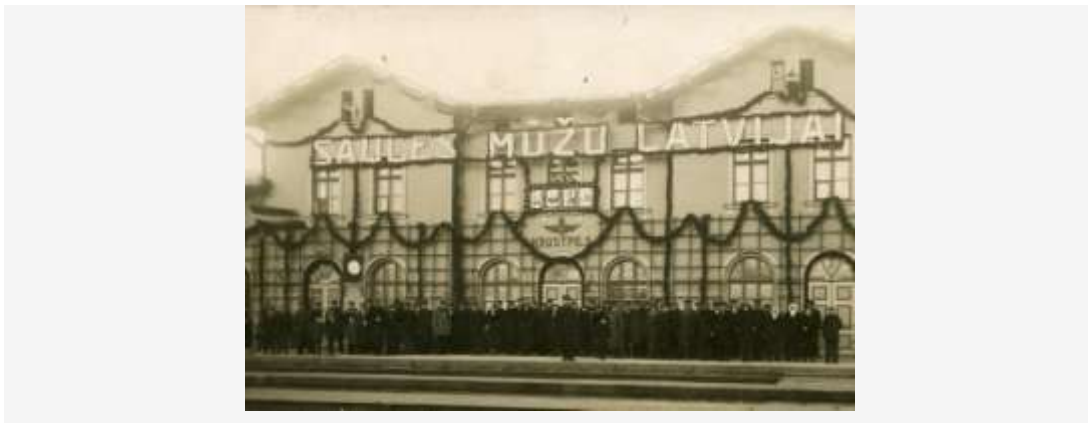
Krustpils stacija 18.novembrī.