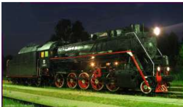
Foto: L sērijas tvaika lokomotīve Nr. 0312 ar atjaunoto apgaismojumu

Tvaika lokomotīvei L-312 atjaunota elektroinstalācija. Darbus veica muzeja voluntieris Pjotrs Sokolovs.